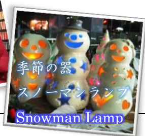
季節の器 スノーマンランプ Snowman Lamp