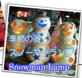
季節の器 スノーマンランプ Snowman Lamp